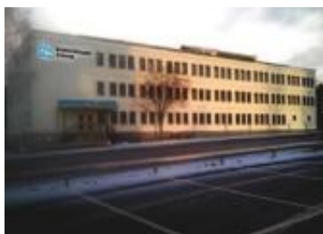
Djursjukhuset Albano