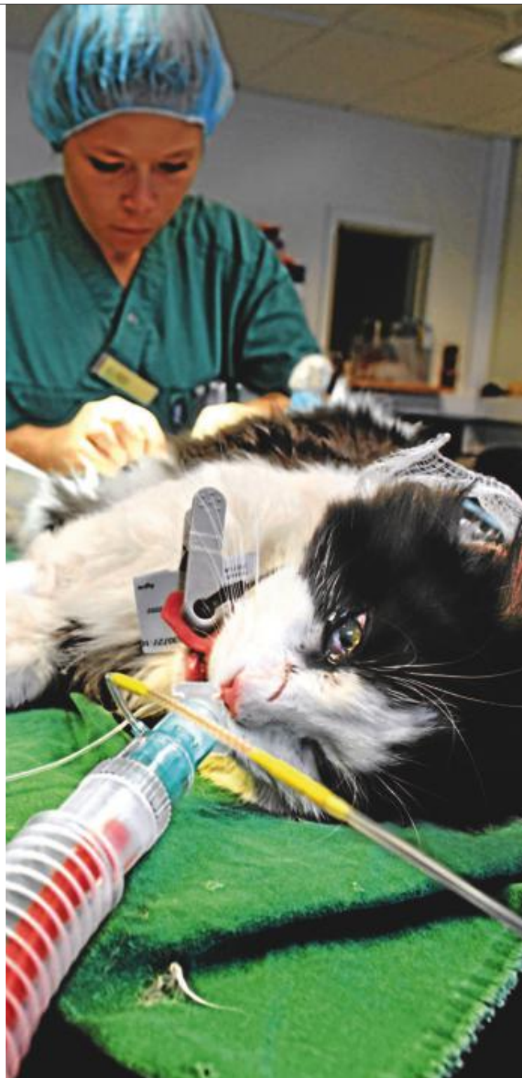
På stora djursjukhus kostar vård mer än på en liten klinik.